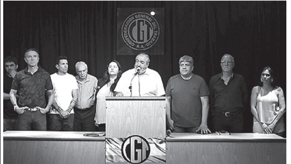
Héctor Daer anuncia la convocatoria a un paro nacional de la CGT para el 24 de enero.

El Comité Central Confederal declaró la medida de fuerza a partir de las 12 de ese día. La central obrera realizará el 10 de enero un plenario nacional de sus delegaciones regionales. Las dos Centrales de Trabajadores de la Argentina (CTA) y de la Unión de Trabajadores de la Economía Popular (UTE) resolvieron sumarse al paro.