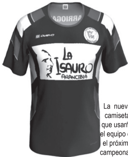
La nueva camiseta que usará el equipo en el próximo campeonato

Futbolistas veteranos de la Liga de Fútbol del Oeste (LAFAO) cumplen su ansiado sueño de terminar la secundaria a través de un proyecto especial del Plan FinEs en la Sociedad de Fomento General San Martín de Barrio Gaona, en el partido de Morón.