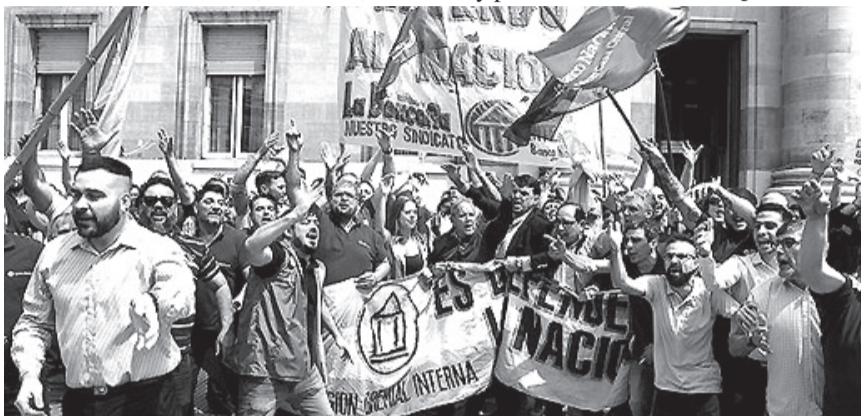
Empleados del Banco Nación manifiestan contra la privatización de la entidad

Cuenta con más de 17.000 empleados, 790 sucursales en el país, 16 en el exterior, más de 180.000 cuentas corrientes, 625.000 cajas de ahorro, 260.000 plazos fijos, activos y es el principal Banco Argentino que cubre prácticamente todo el país, con depósitos que conforman alrededor del 20% del sistema financiero y sus créditos que van hacia el agro; servicios; industria, comercio y para la construc-