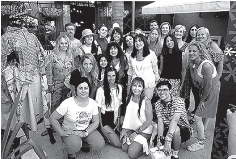
Los y las emprendedoras que participaron en la Feria Fuera de Serie en Ituzaingó.

R.: Sí, me lo han pedido, he hecho taller de