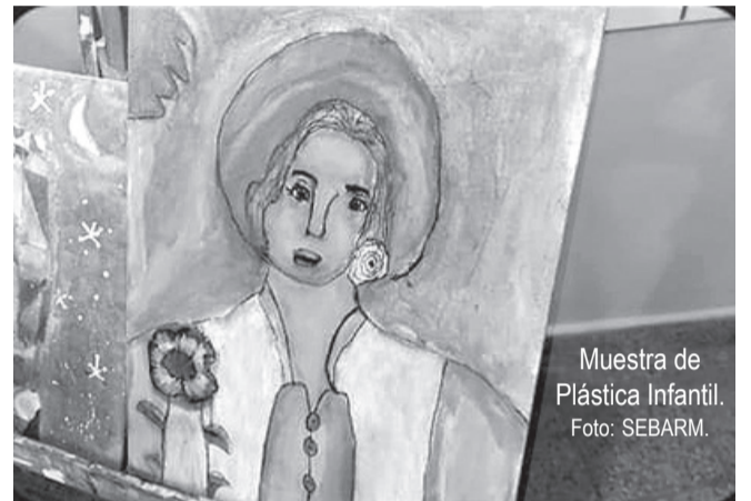
Muestra de Plástica Infantil.