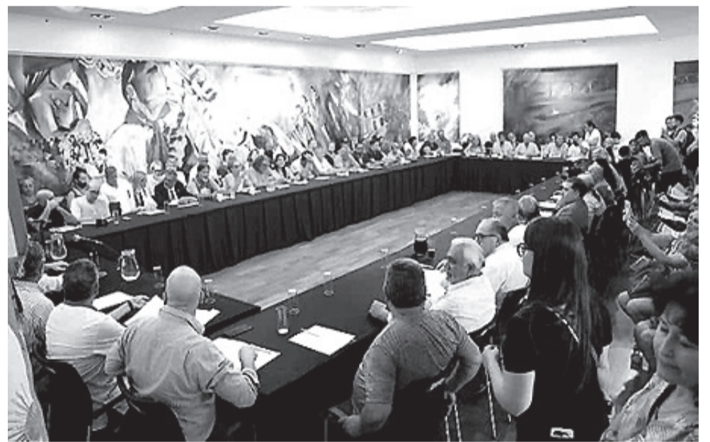
La Multisectorial se declaró en alerta defender a la producción nacional, el comercio y el trabajo.

Por su parte el intendente Pablo Descalzo expresó: "es necesario y urgente presentar en unidad el rechazo al DNU porque va en contra de las instituciones democráticas, intenta reemplazar al Congreso incumpliendo el artículo 29 de la Constitución Nacional en beneficio de los intereses corporativos de los grandes grupos de poder económico".