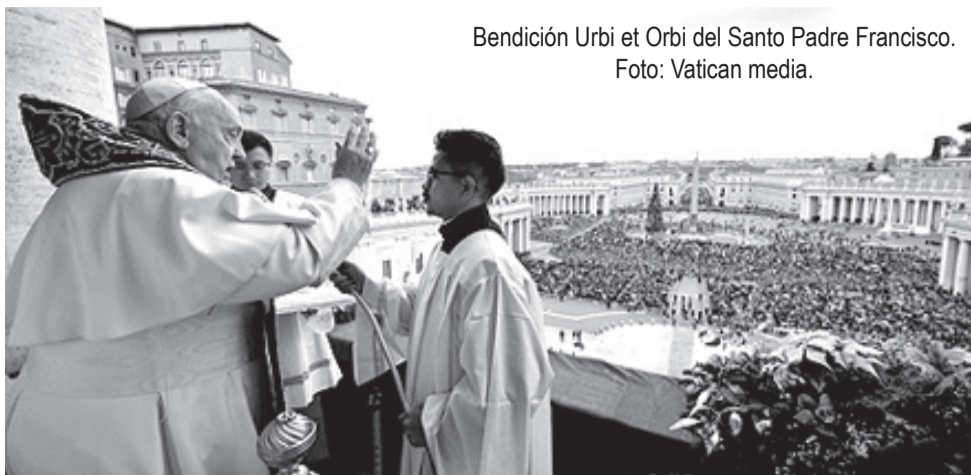
Bendición Urbi et Orbi del Santo Padre Francisco.

Que no se siga alimentando la violencia y el odio, sino que se encuentre una solución a la cuestión palestina, por medio de un diálogo sincero y perseverante entre las partes, sostenido por una fuerte voluntad política y el apo-