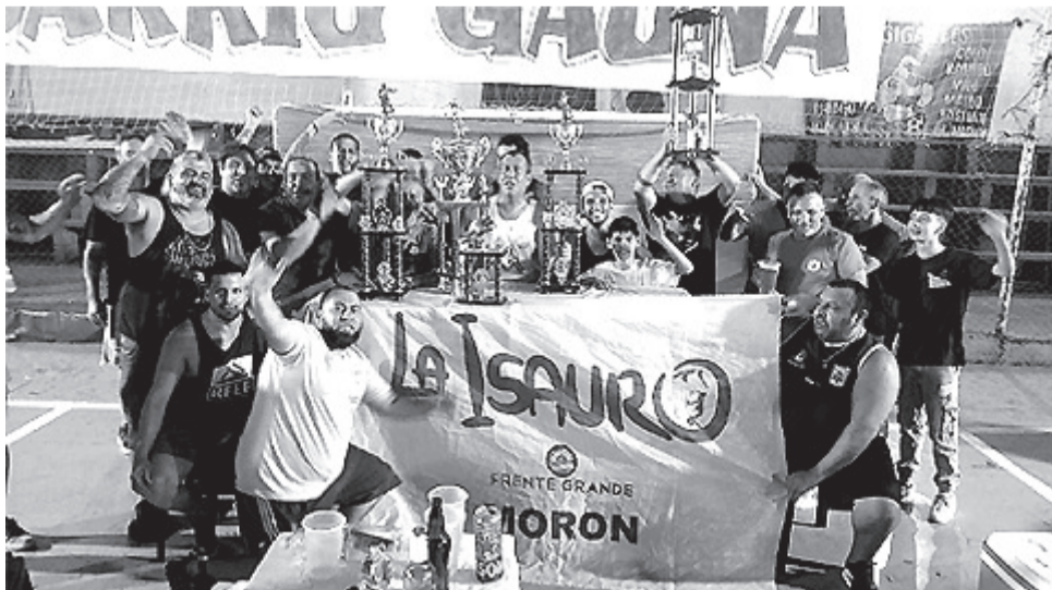
El fútbol de veteranos de la institución se consagraron campeones generales de la Liga del Oeste.

Hasta el momento, el proyecto ha tenido un impacto positivo en los participantes. Muchos de ellos han expresado que se sienten motivados a continuar sus estudios y que el proyecto les ha permitido mejorar su calidad de vida.