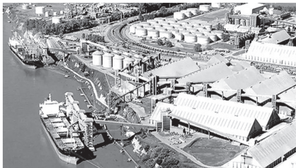
Desregulación del Comercio Exterior. Los puertos del Paraná de la República de la Soja.

o En lo que hace al control físico de las mercaderías, se debilita la efectividad del control en la tarea de verificación ya que, si la presunta infracción no tiene pena de comiso, no corresponde detener el curso del despacho como ocurría hasta el momento. Ello implica la posibilidad de que, por ejemplo, pese a detectarse una diferencia entre lo declarado y lo comprobado que conlleve que la mercadería sometida a despacho sea de importación prohibida por no ajustarse a los requerimientos sanitarios, no pueda detener-