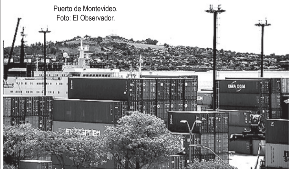
Puerto de Montevideo.

La situación de 2014 en la que la licitación no