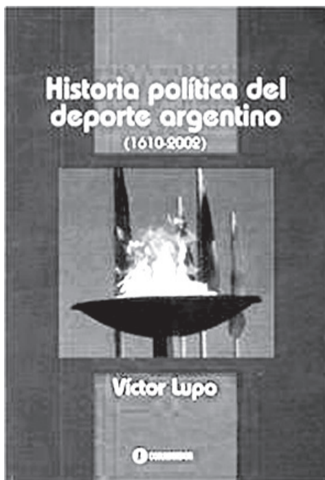
"Historia Política del Deporte Argentino (1610-2002)".