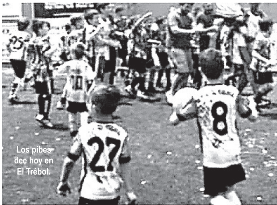
Los pibes de hoy en El Trébol.