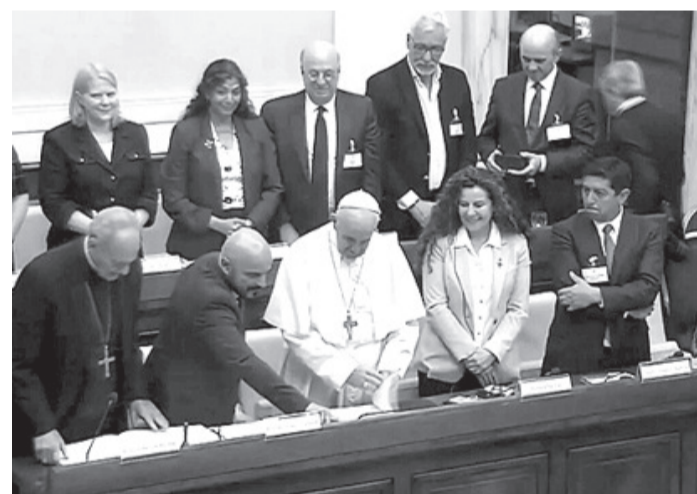
Constitución del Comité con Francisco en el Vaticano en junio de 2018.

Apruebo asimismo la creación del Instituto para la investigación y promoción de los Derechos Sociales "Fray Bartolomé de las Casas", con finalidades académicas, docentes y de formación sobre la temática de Derechos