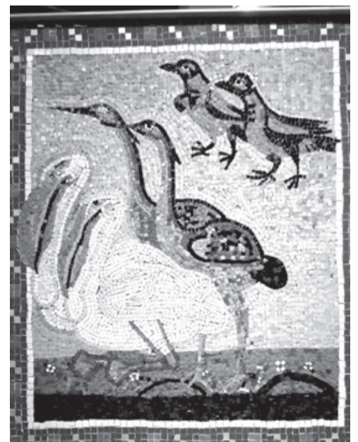
Los Pájaros del Arca por Bianca Furano