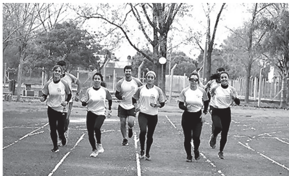
La inscripción puede hacerse en el sitio web de Madre Tierra: www.maratonsolidaria.madretierra.org.ar .

Madre Tierra es una organización sin fines de lucro nacida en Morón en 1985. Su misión es promover acciones que faciliten el acceso a la tierra y la vivienda para familias necesitadas, generando condiciones de desarrollo y justicia social en los barrios donde trabaja. Actualmente, Madre Tierra ha impactado la vida de miles de personas, construyendo barrios, mejorando viviendas y brindando capacitaciones y asesorías legales. Su compromiso es seguir trabajando por un hábitat más justo y sostenible para todos.