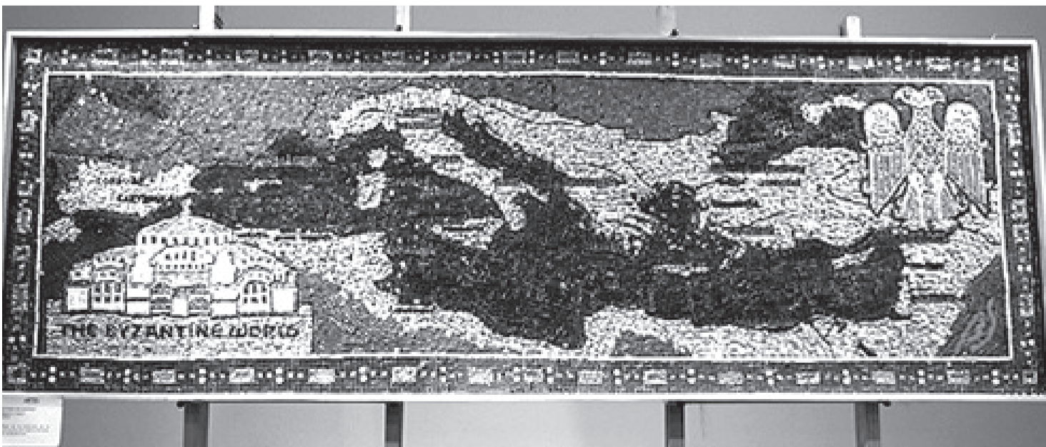
"Mundo Bizantino" obra de Beatriz Segni. Mosaico de 154 x 52 cm. Donado al Colegio Ward en la inauguración de la muestra del colectivo ARTODOS "Arte mosaico. Ravenna: cuna del mosaico", en el marco de la 45° Temporada de las Artes.