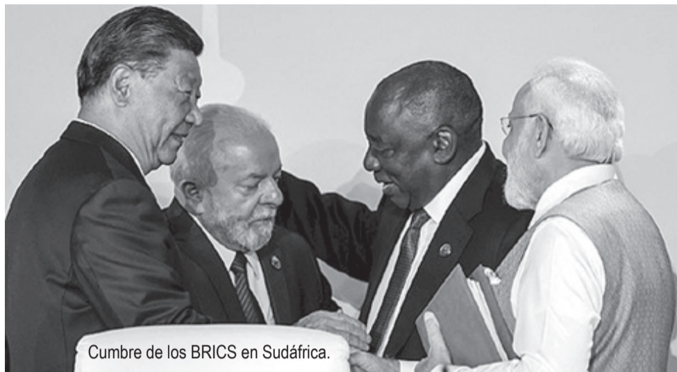
Cumbre de los BRICS en Sudáfrica.

Además, está autorizado a garantizar, participar, otorgar préstamos o respaldar a través de cualquier otro instrumento financiero, proyectos públicos o privados, así como invertir en el capital social, suscribir la emisión de capital social de valores, o facilitar el acceso a los mercados de capitales internacionales de cualquier empresa comercial, industrial, agrícola