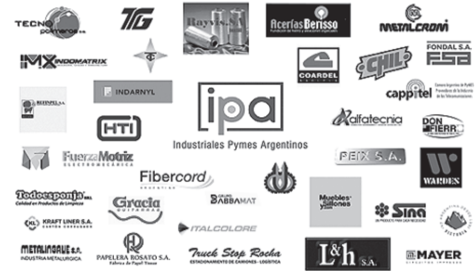
Industriales Pymes Argentinas: Solo algunas de las empresas comprometidas con IPA y la lucha de cada día por las Pymes Industriales Argentinas. Imagen y texto: IPA