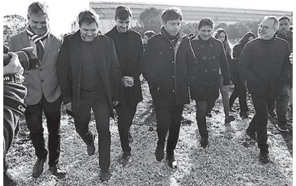
El Presidente de la Unión Industrial del Oeste (UIO), Edgardo Gambaro junto al Intendente de Morón Lucas Ghi, al Gobernador de la Provincia Axel Kicillof y al ex Intendente Martín Sabbatella recorrieron la ampliación del Parque Industrial La Cantábrica de Haedo.

Por su parte, el gobernador expresó: "Cuando recorrimos en 2019 este mismo Parque Industrial, estaban todas las empresas apenas subsistiendo y al borde de la quiebra, producto de un modelo de achicamiento de la industria