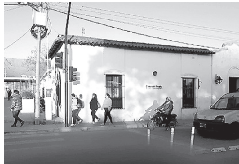
Casa del Poeta Antonio Esteban Agüero,