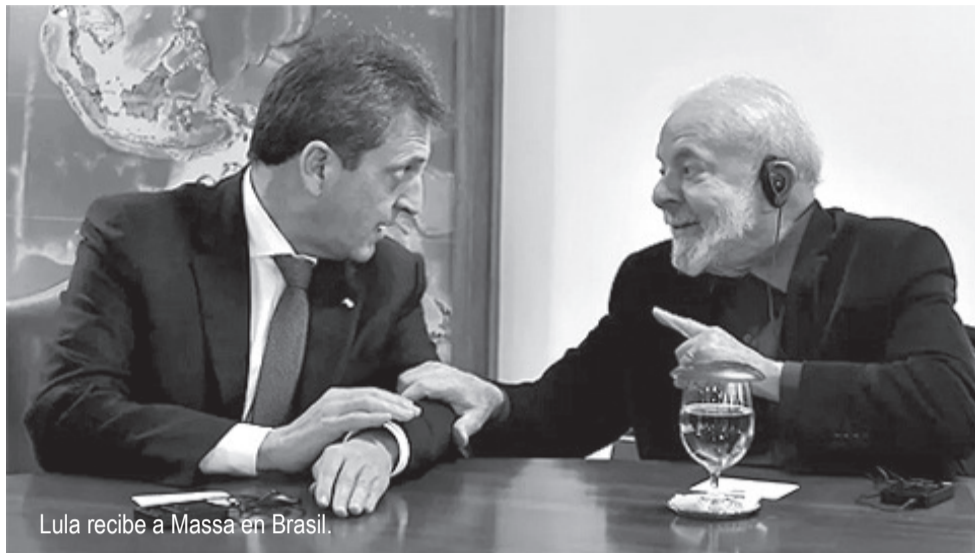
Lula recibe a Massa en Brasil.

ción de los pueblos. Veo en parte, que los anuncios del gobierno van en dirección correcta, pero, dado el impacto negativo de la devaluación, la suma fija es insuficiente y debió pagarse de una sola vez,