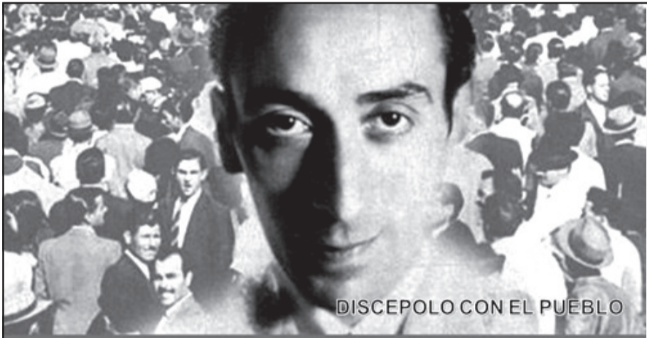
DISCEPOLO CON EL PUEBLO

Acercate a nuestra SECCIONAL ITUZAINGÓ Zufriategui 676 - Tel. 4661-7100 De lunes a viernes de 9:00 a 13:00 hs. y de 15:00 a 19:00