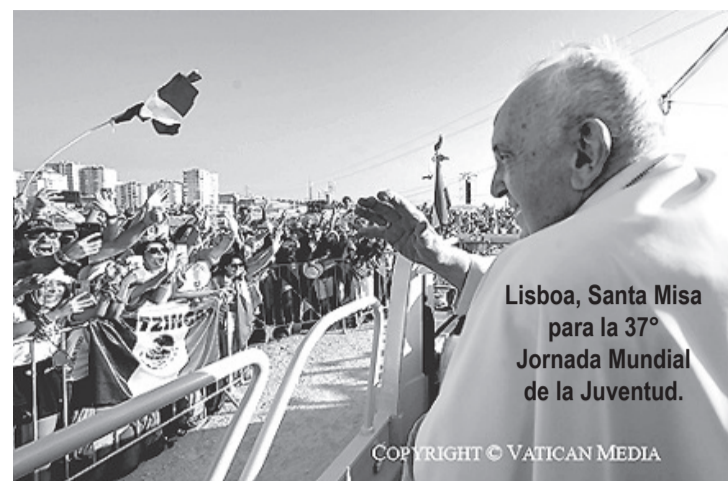
Lisboa, Santa Misa para la 37ª Jornada Mundial de la Juventud.

A ustedes, jóvenes, tentados en este tiempo por el desánimo, por juzgarse quizás fracasados o por intentar esconder el dolor disfrazándolo con una sonrisa; a ustedes, jóvenes, que quieren cambiar el mundo -y está bien que quieran cambiar el mundo- y que quieren luchar por la justicia y la paz. A ustedes, jóvenes, que le ponen ganas y creatividad a la vida,