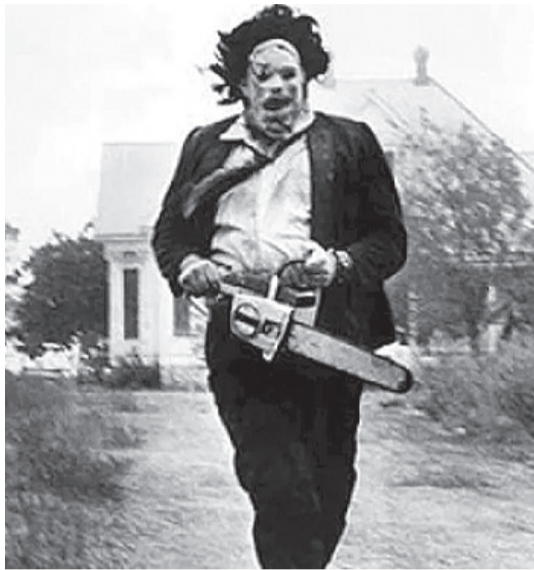
En 2024 se cumplen 50 años del estreno de El Loco de la Motosierra película dirigida por Tobe Hooper.

En esta elección 6 de cada 10 electores tiene menos de 45 años y el 30% menos de 30 años. Según un estudio del CEPA, (Centro de Estudios Políticos Argentinos) casi el 60% de adolescentes y Jóvenes de hasta 24 años, no ac-