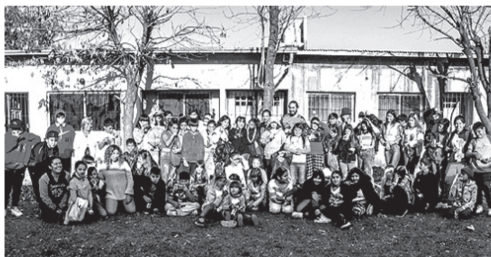
Los fondos recaudados en la Carrera Solidaria se destinarán a mejorar las instalaciones del Centro de Infancias del barrio El Milenio, en Cuartel V, Moreno,