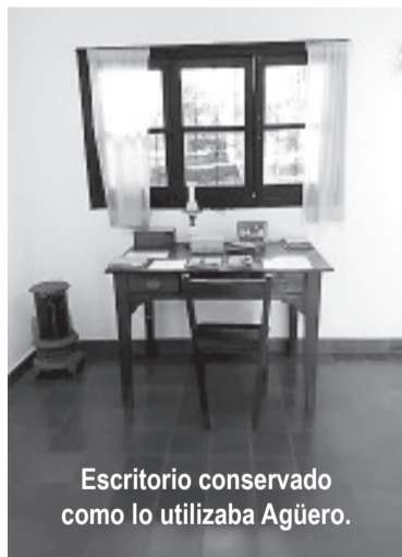
Escritorio conservado como lo utilizaba Agüero.

También arriesgamos con escasa o ninguna suerte unas pocas fichas en el paño verde del Casino Flamingo lindero a la Avenida del Sol que conecta el casco céntrico con el serpenteante camino que lleva y trae desde El Rincón del Este, Piedra Blanca y Salto del Tabaquillo, entre otros bellos paseos naturales. Pero, considerando que dichas atracciones pueden leerse con más provecho en las páginas web del tu-